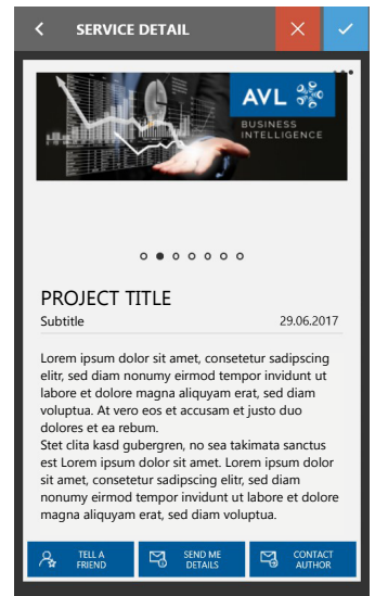
Abb. 4: Projektdetails