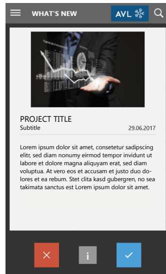
Abb. 2: Projektübersicht