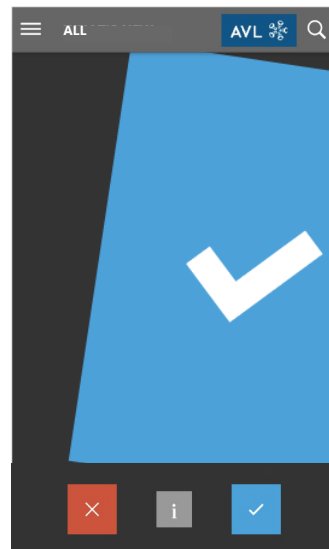
Abb. 3: Swiping-Anzeige